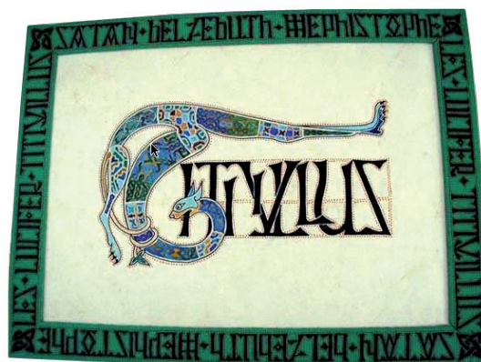
Images : Titivillus, démon protecteur des copistes (Laurence Couteaux, Asociación Española de Caligrafía)

Avec, dans l'après-midi du 19 février, une Table-ronde Ecdotique